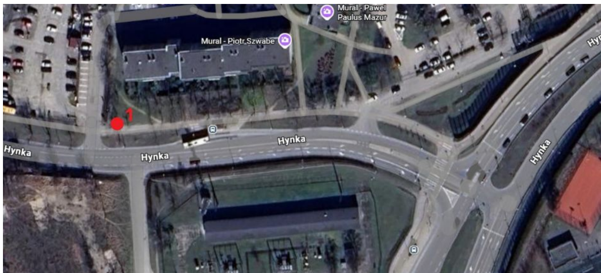
Lokalizacja wnioskowanego drzewa do usunięcia.