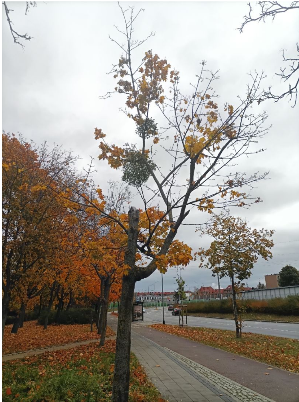
Fotografia nr 1 - sylwetka wnioskowanego drzewa nr 1.

Załącznik nr 2 do pisma PD.5103.315.2026.KB