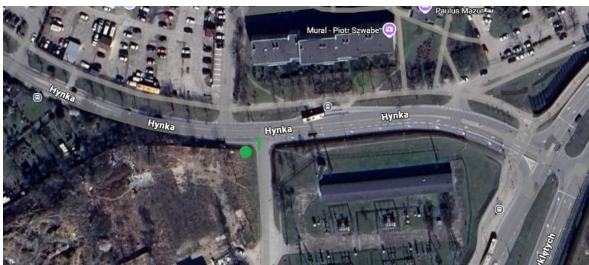
Plan nasadzenia zastępczego.