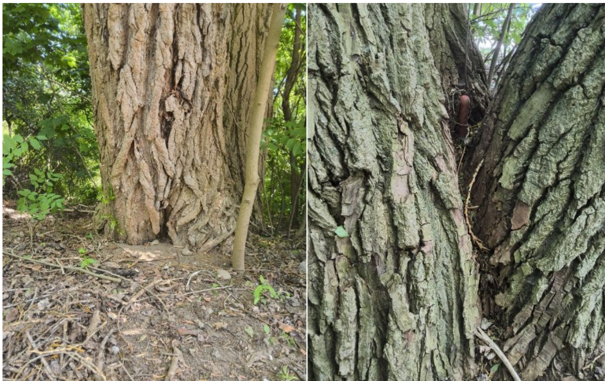
Dokumentacja fotograficzna drzewa nr 2 – detal