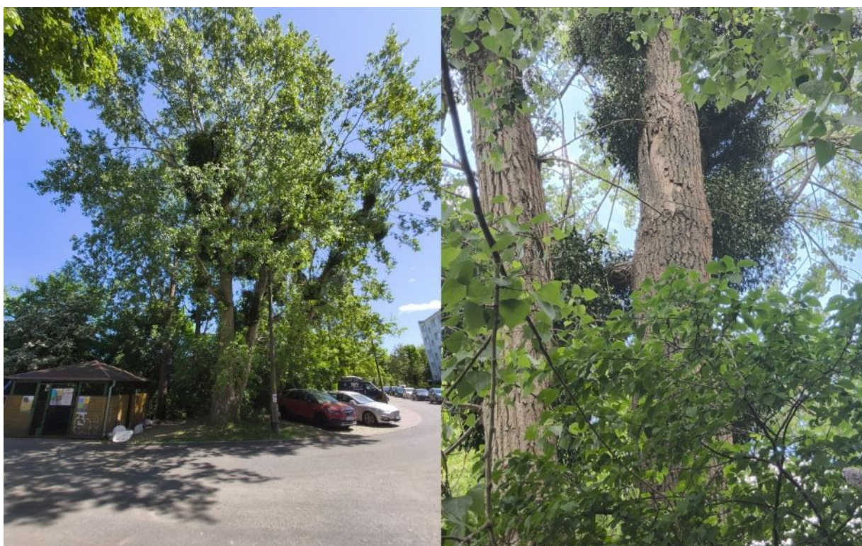
Dokumentacja fotograficzna drzewa nr 2