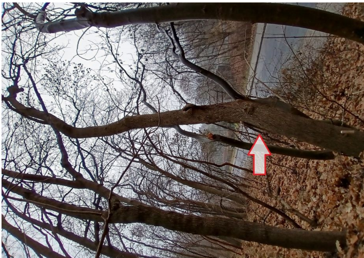
Dokumentacja fotograficzna drzewa nr 2