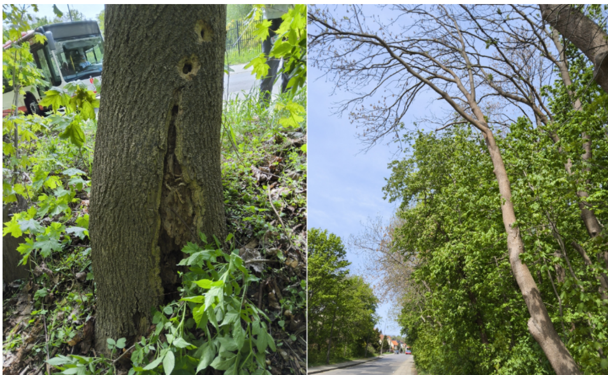
Dokumentacja fotograficzna drzewa nr 3