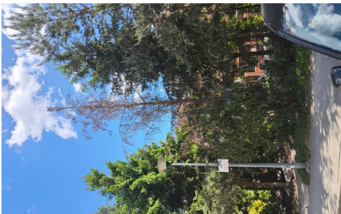
Dokumentacja fotograficzna drzewa