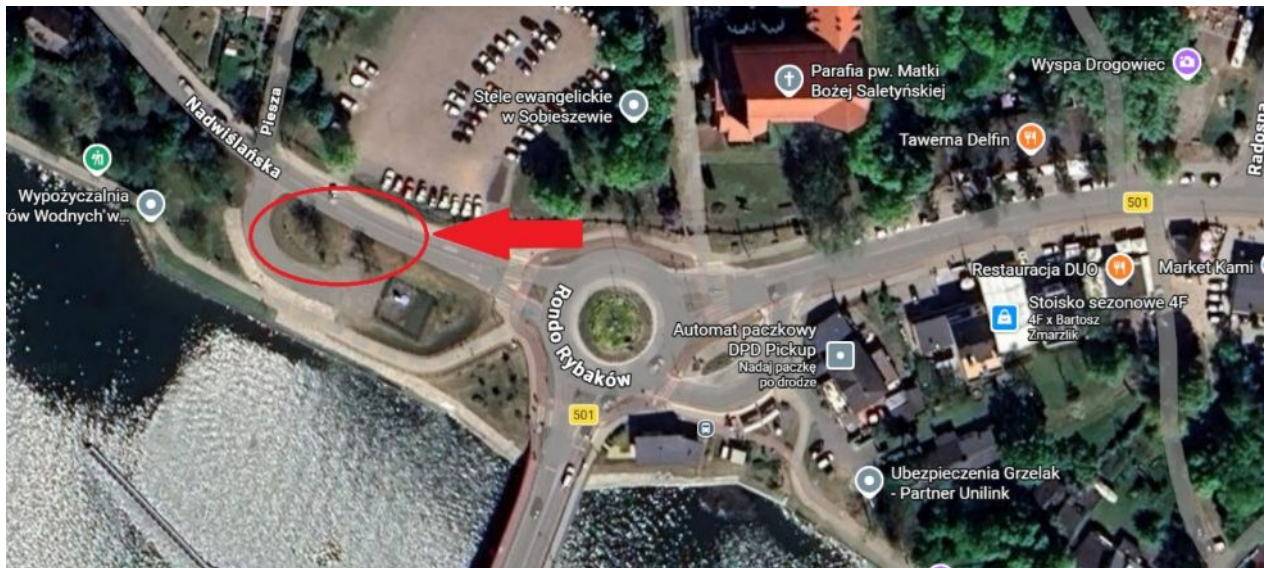
Mapa - lokalizacja wnioskowanych drzew do usunięcia.