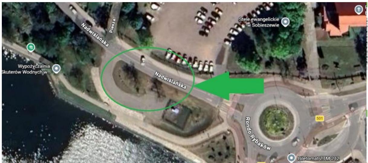
Lokalizacja drzew do nasadzenia.