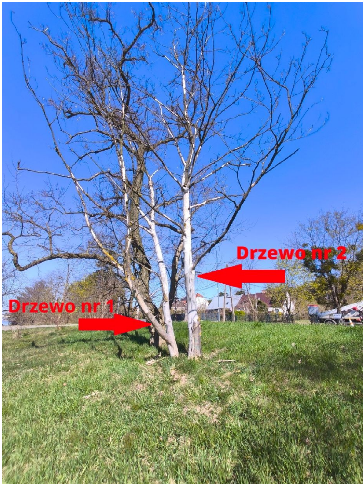
Fotografia nr 1 – sylwetka drzewa nr 1 i drzewa nr 2.