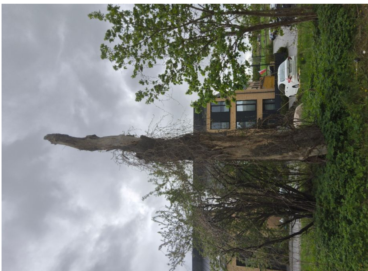
Dokumentacja fotograficzna drzewa