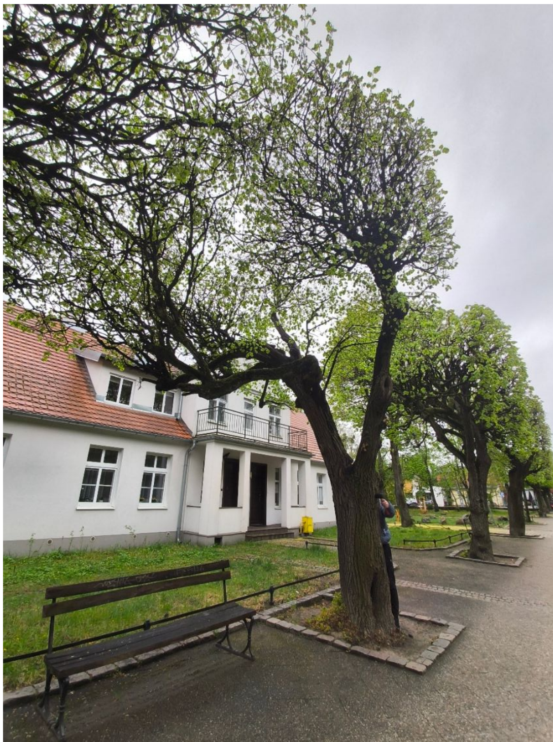
Fotografia nr 1 – sylwetka wnioskowanego drzewa.