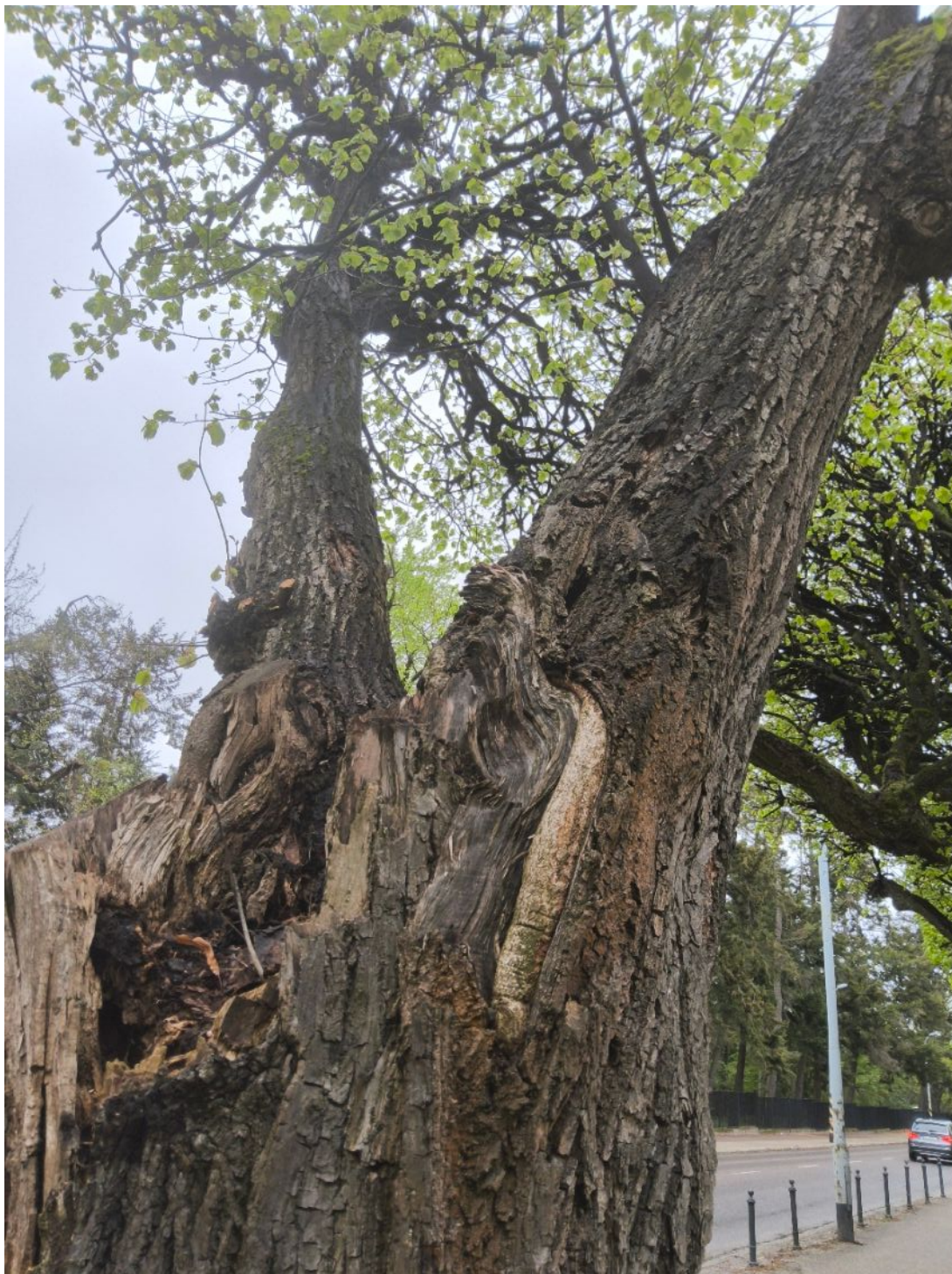
Fotografia nr 3.