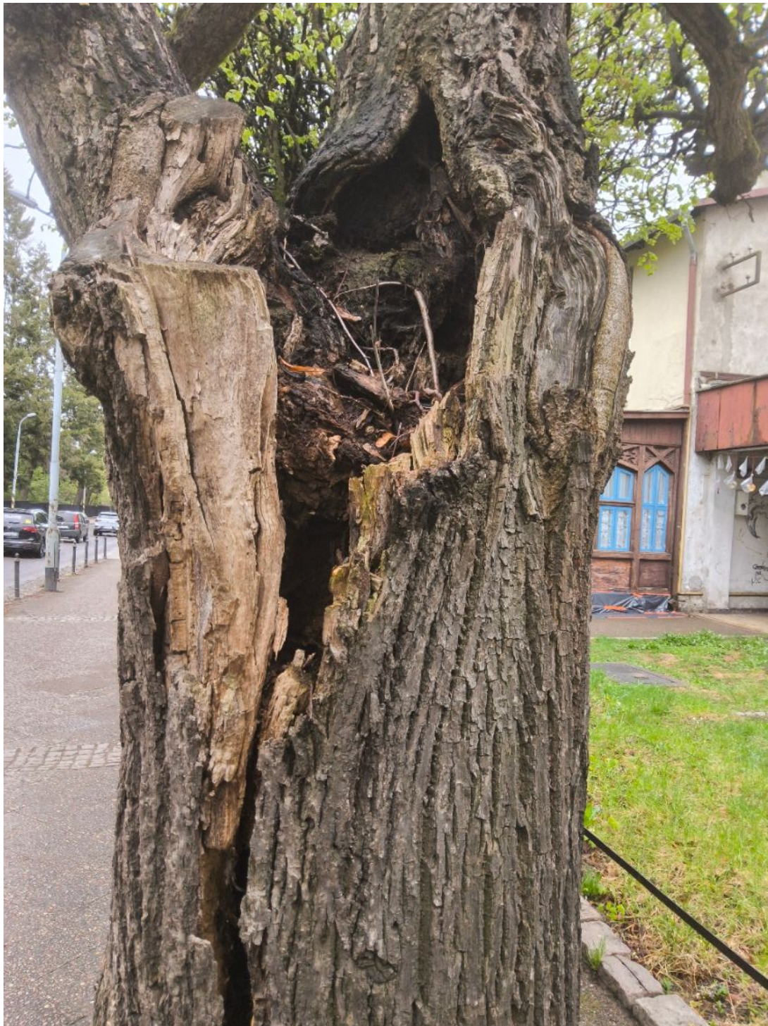
Fotografia nr 2.