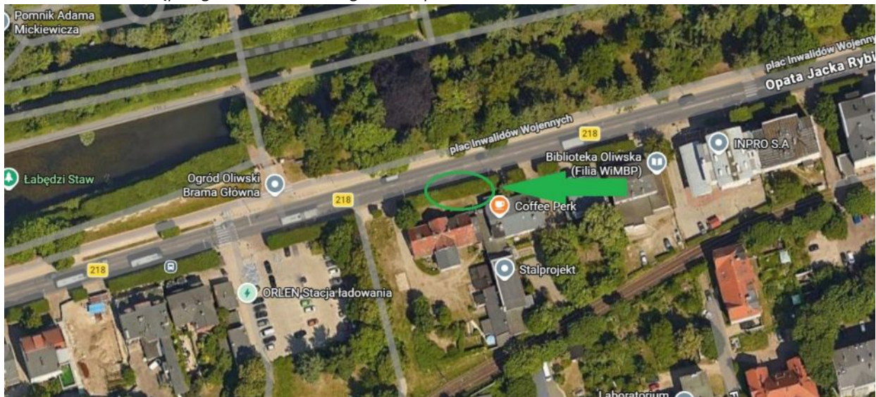
Lokalizacja drzewa do nasadzenia.