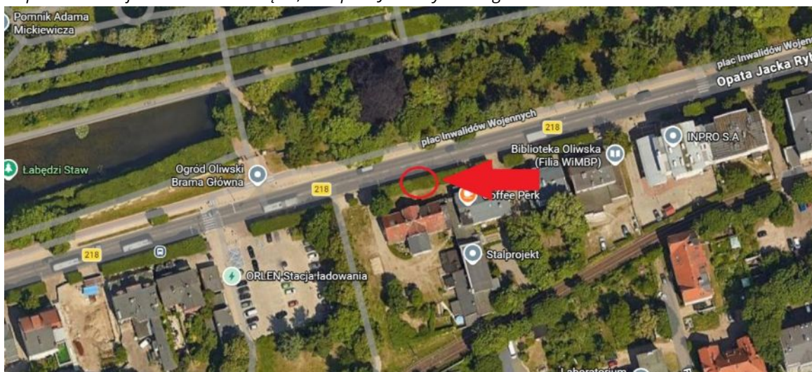
Lokalizacja drzewa do usunięcia.