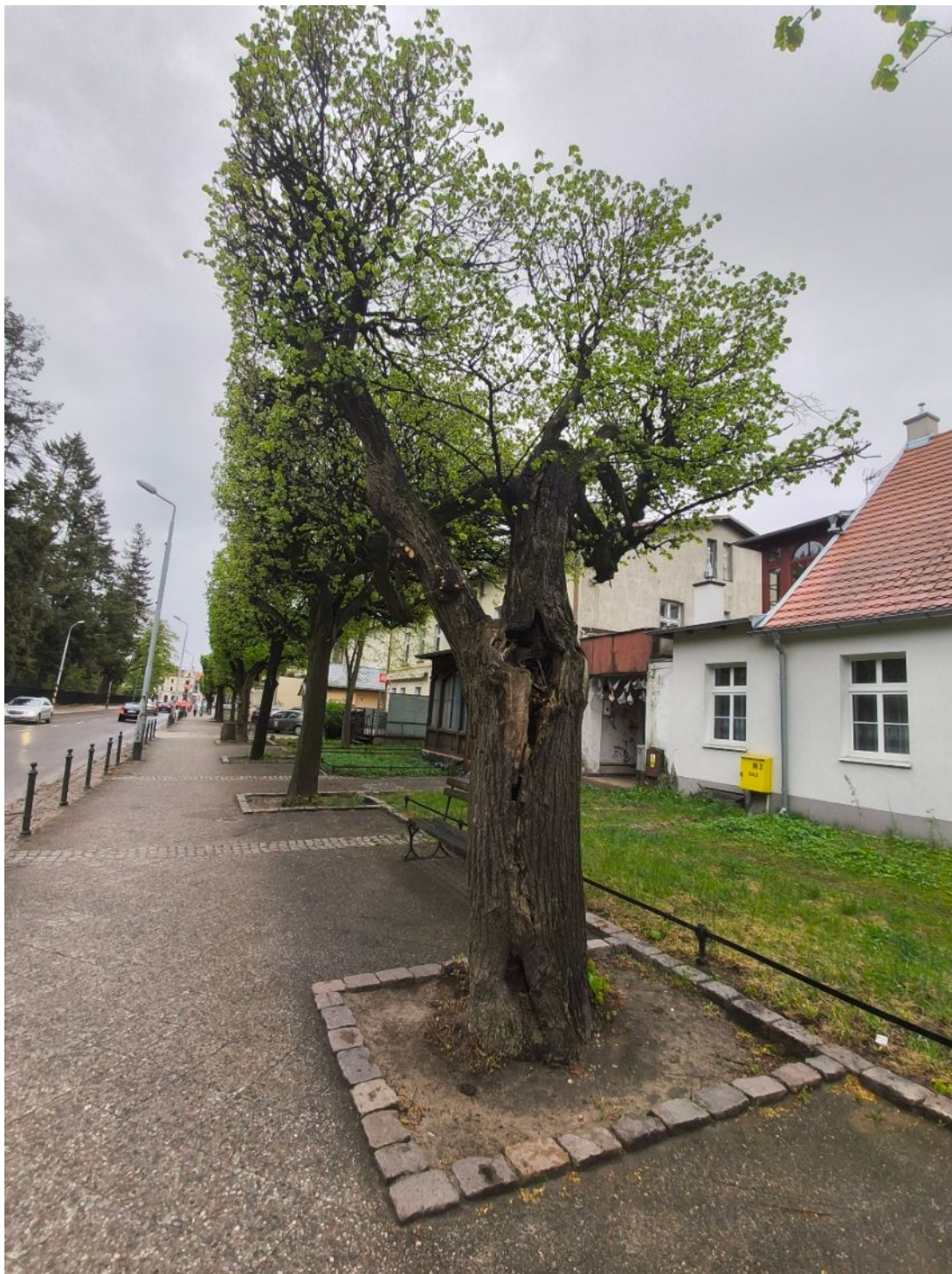
Fotografia nr 4.