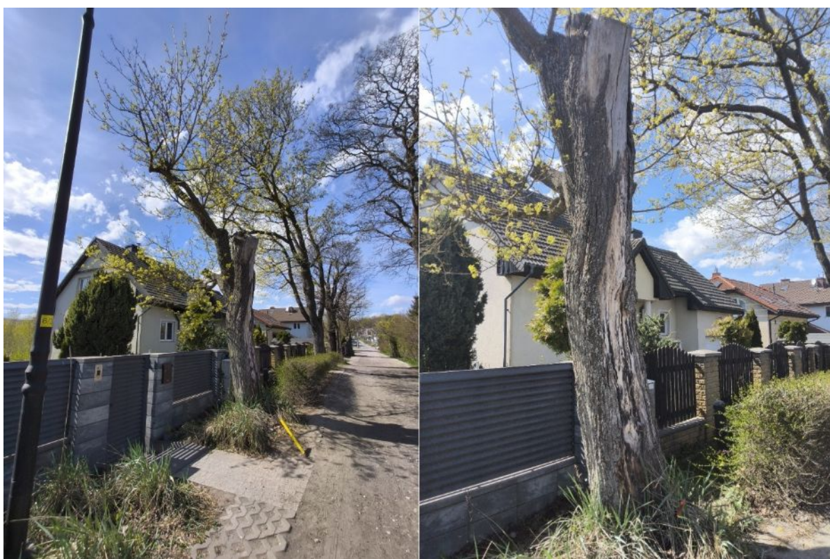
Dokumentacja fotograficzna drzewa