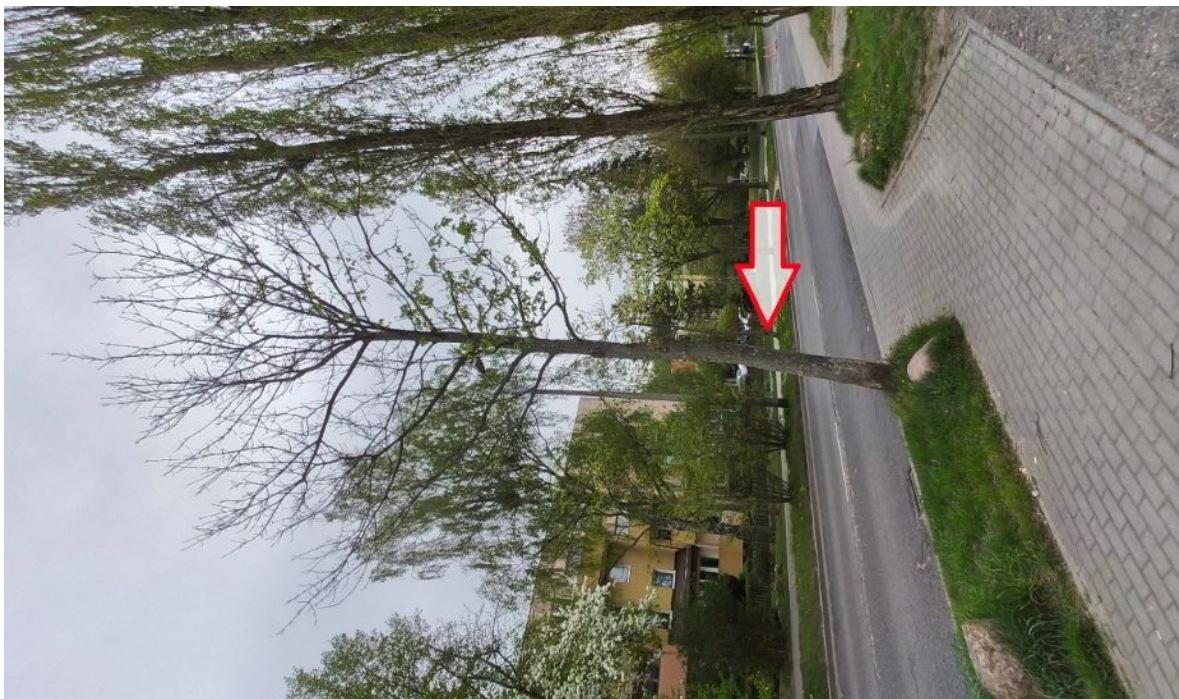
Dokumentacja fotograficzna drzewa nr 1