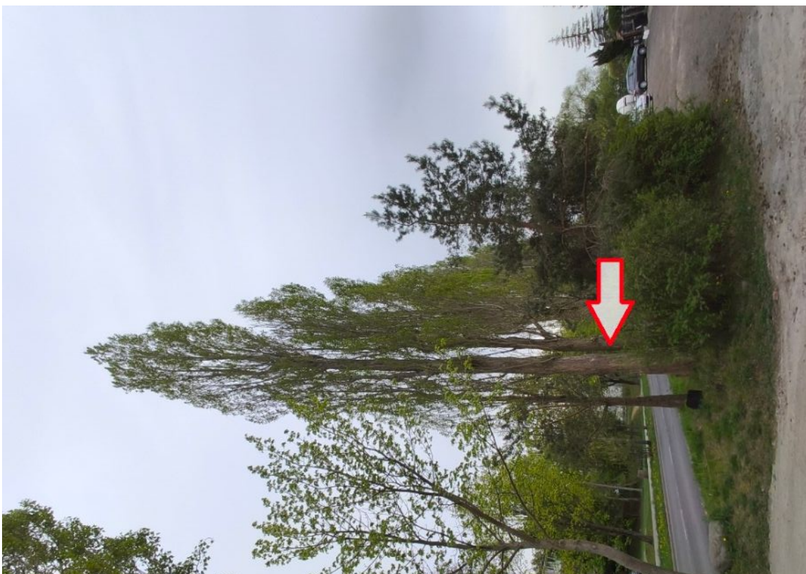
Dokumentacja fotograficzna drzewa nr 2