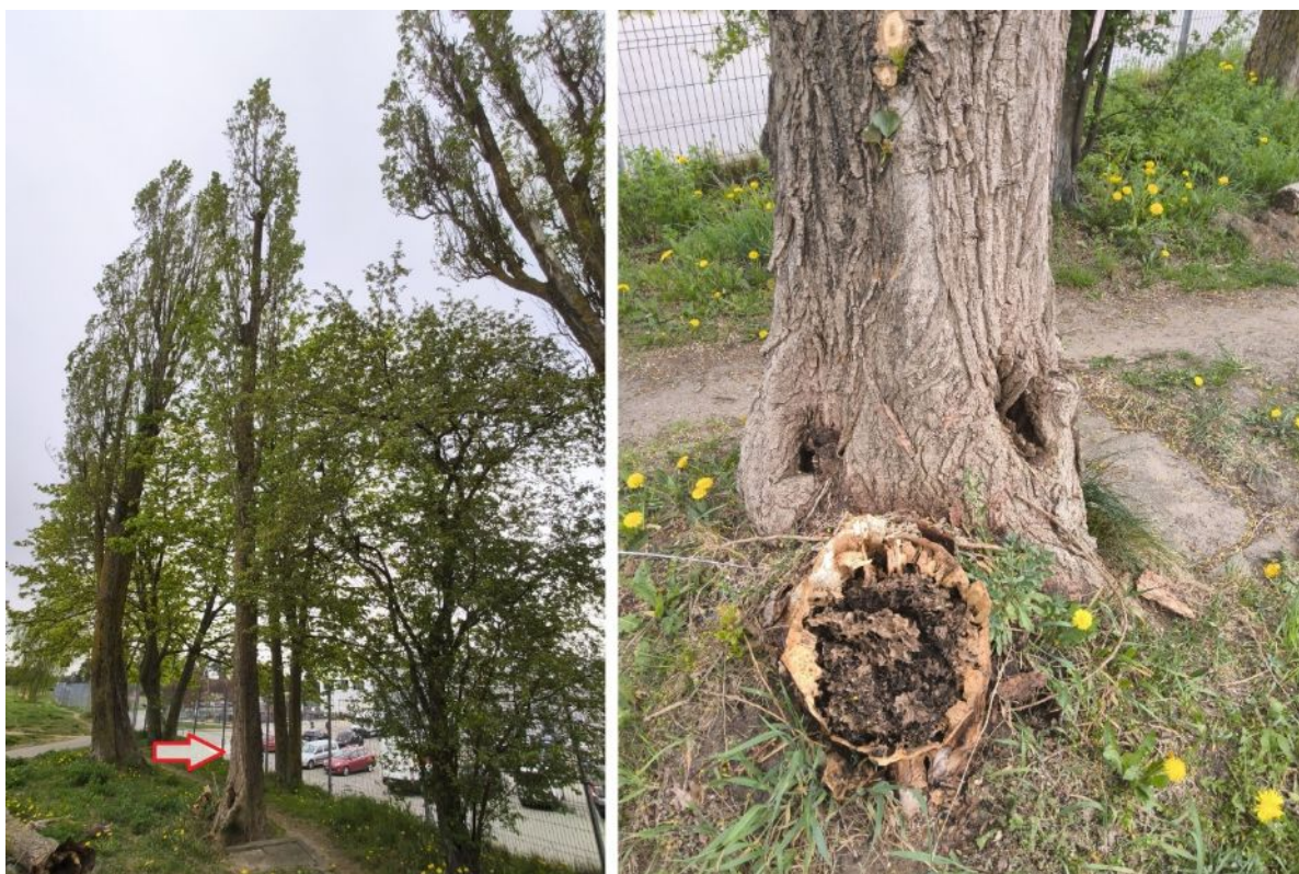
Dokumentacja fotograficzna drzewa nr 4