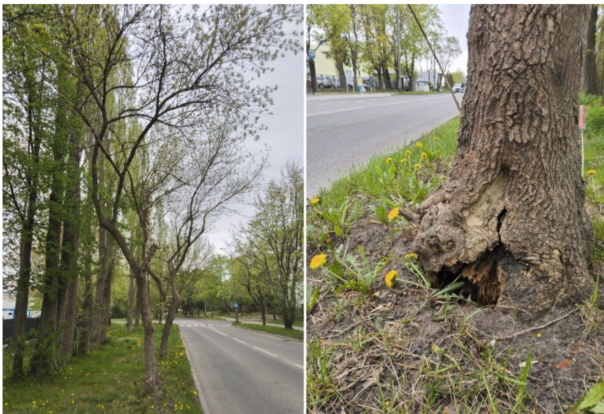
Dokumentacja fotograficzna drzewa nr 3