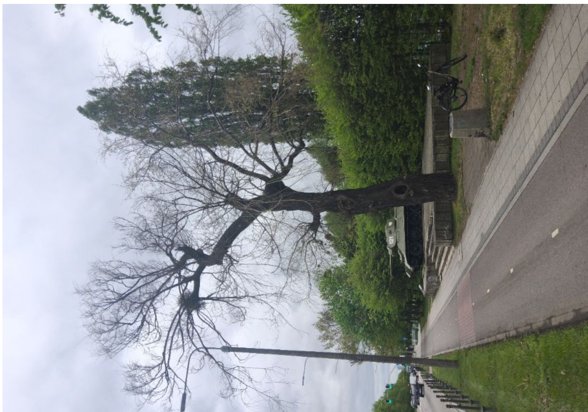
Dokumentacja fotograficzna drzewa