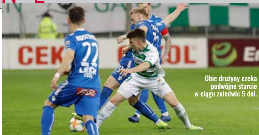
Obie drużyny czeka podwójne starcie w ciągu zaledwie 5 dni.