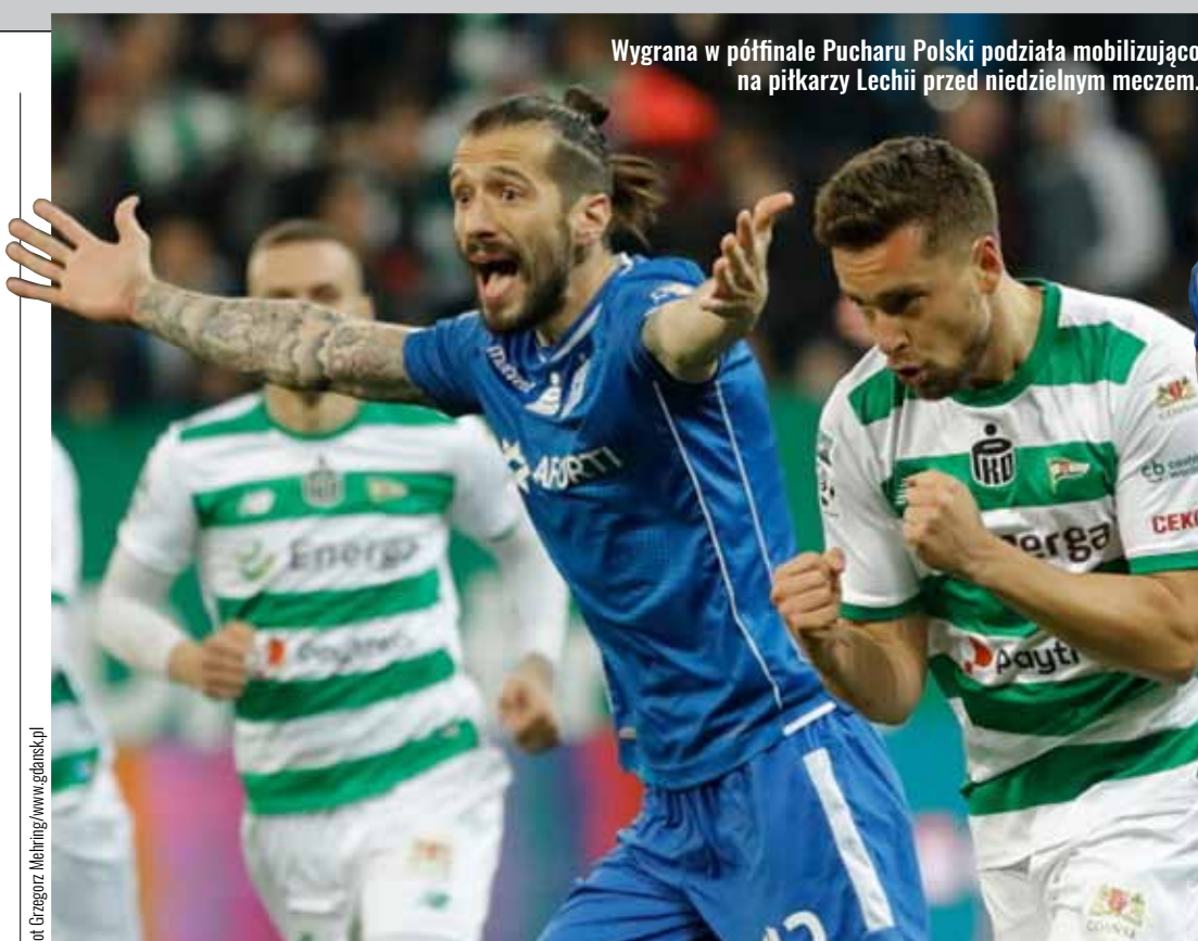
Wygrana w półfinale Pucharu Polski podziela mobilizującą na piłkarzy Lechii przed niedzielnym meczem.