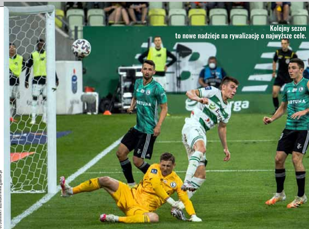
Kolejny sezon to nowe nadzieje na rywalizację o najwyższe cele.